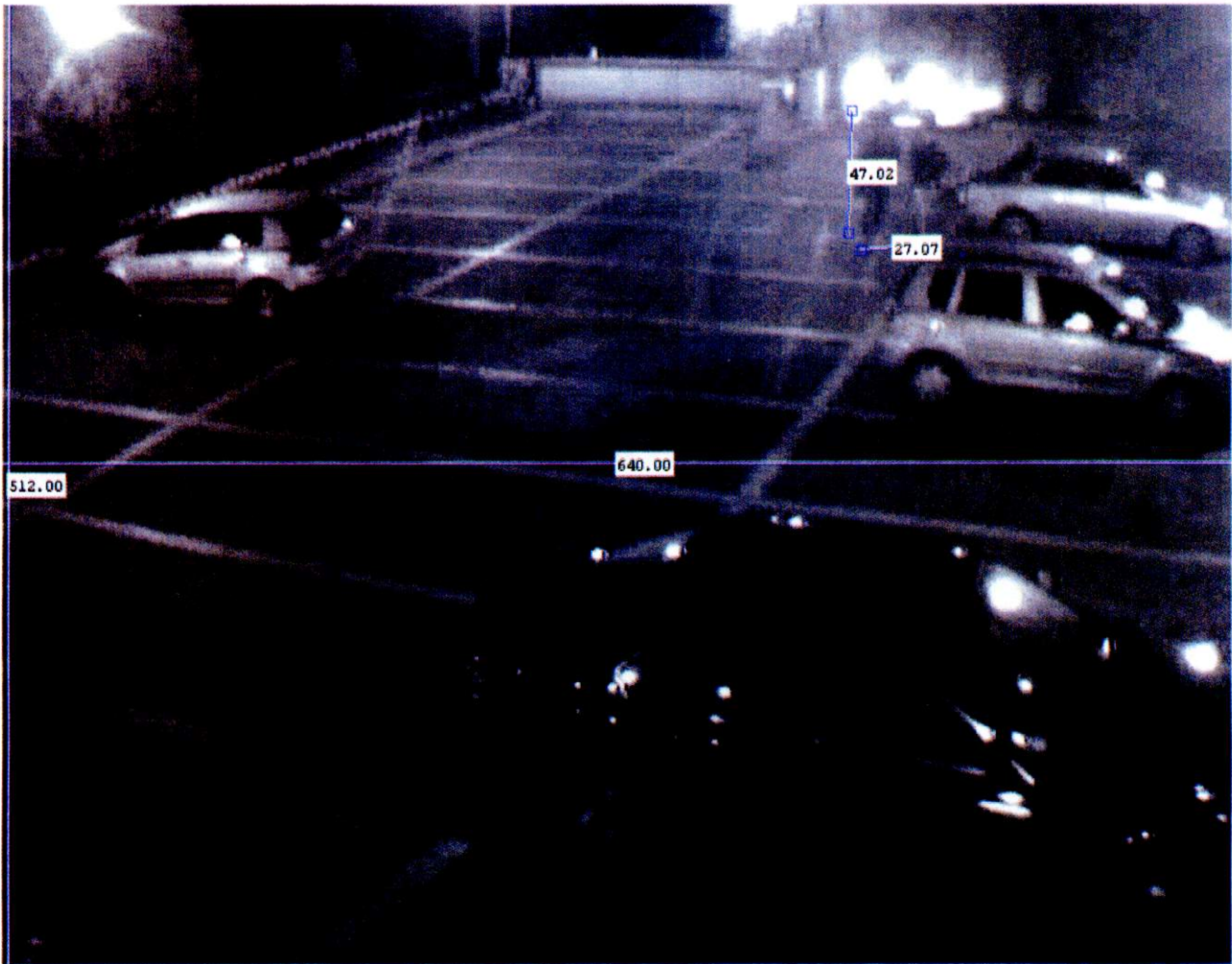
Figura 2 - 02 nov. 2007 00:56:55.810

SERVIZIO POLIZIA SCIENTIFICA I Divisione